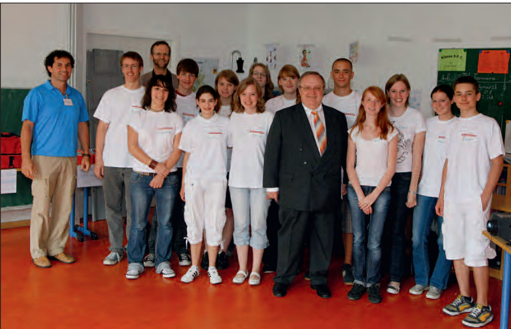
Staatsminister Jürgen Banzer im Kreise der erfolgreichen Schulsanitäter

G ruppenarbeit – zu jedem Einsatz werden mindestens 2 Sanitäter alarmiert